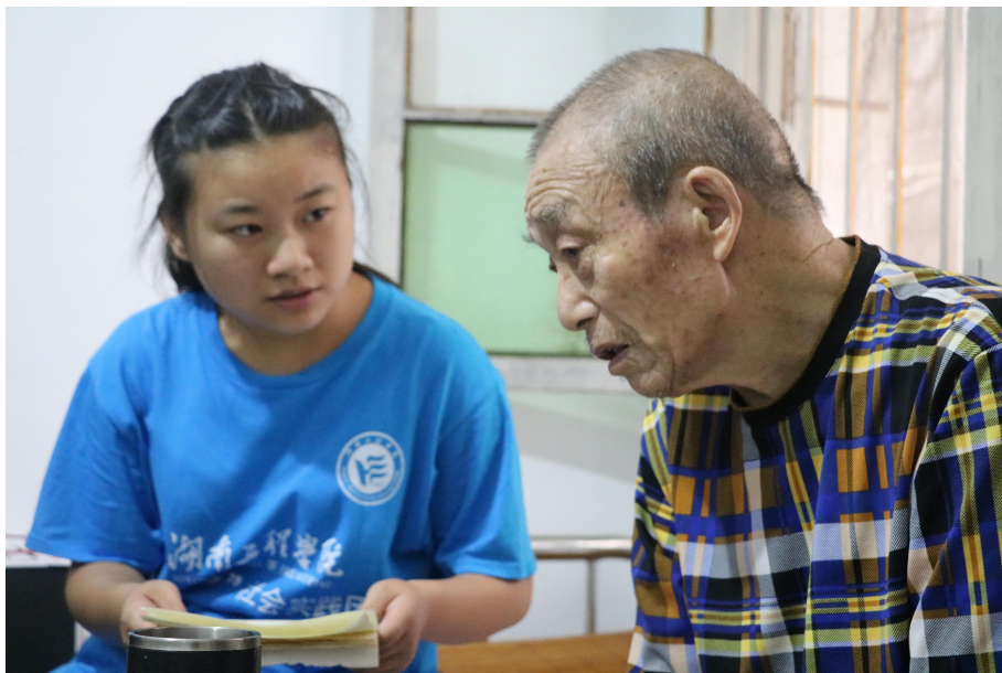
志愿者认真聆听并详细记录袁老讲述的英雄事迹