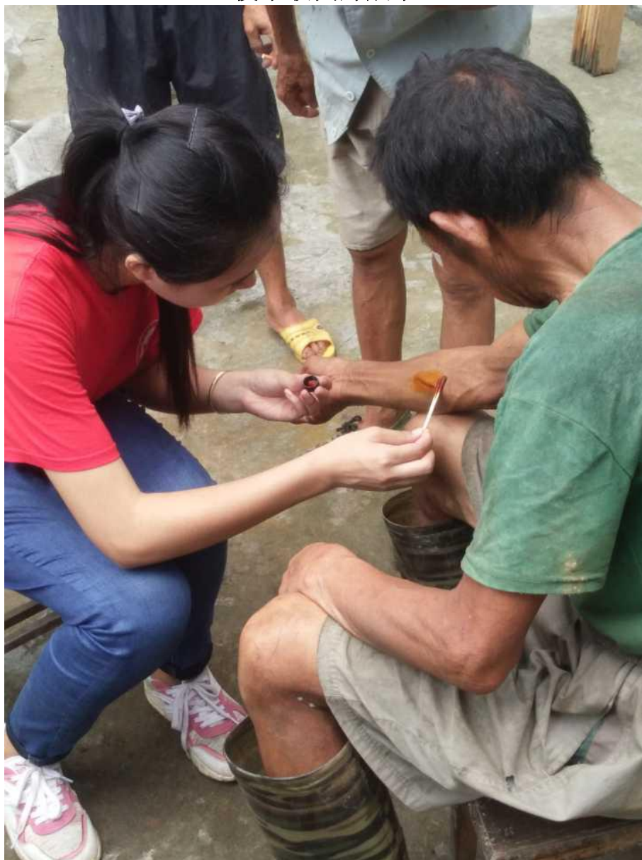
调研组帮受访村民擦药