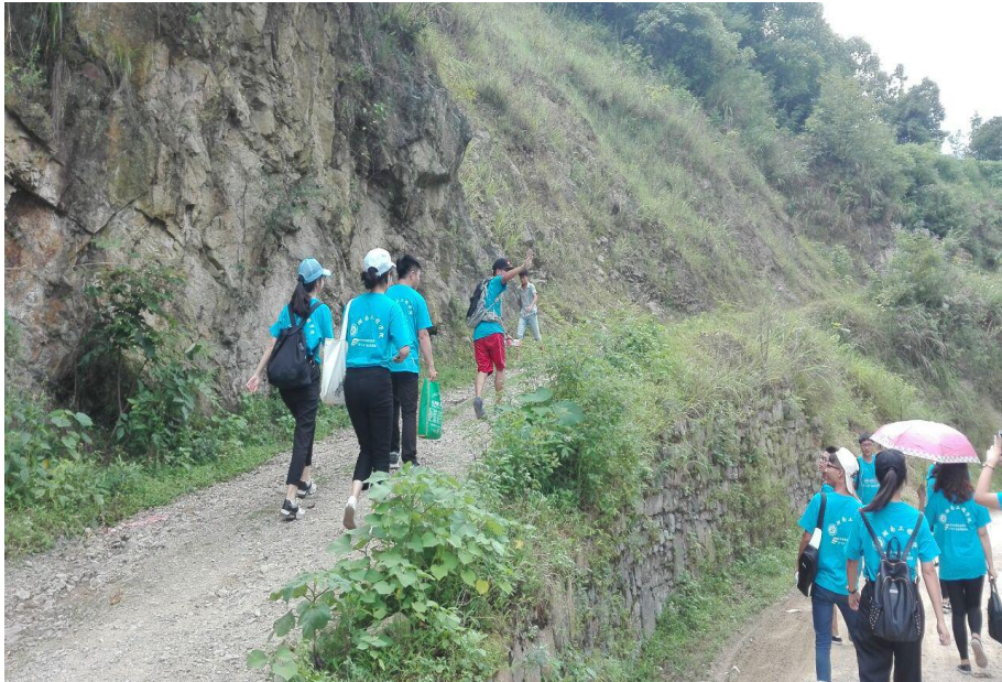
调研组在去调研的路上