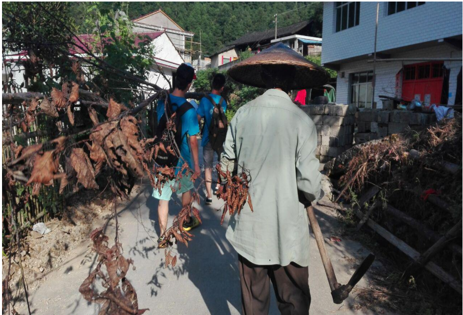
调研组帮村民抬树