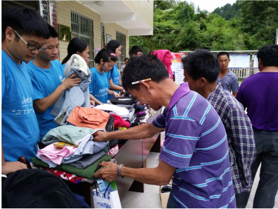
宣讲组给太阳山村村民发放衣物