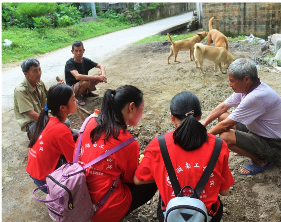
调研组向当地村民了解情况