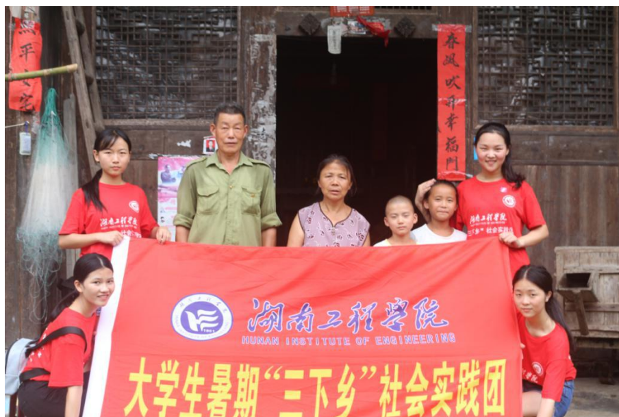
调研组与太阳村村民合影