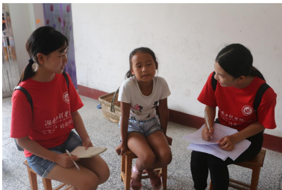
调研组与留守儿童交谈