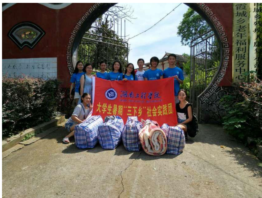
敬老院志愿者的合照

这次活动让我从中学到很多，我们也得到了许多深刻的为人处世的道理。我们志愿者乘车去敬老院。这次敬老院之行在略表心意的同时，更旨在现实客观地诠释和谐二字的涵义，让更多处于黄昏时段的老人感受到社会上最单纯的温暖，让我们更深刻的领会十八大精神。的确，创建和谐社会离不开社会经济与自然环境的和谐发展，更离不开人与人之间关系的和谐构建。